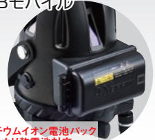
専用リチウムイオン電池パック 単3アルカリ乾電池対応 電池収納ボックス